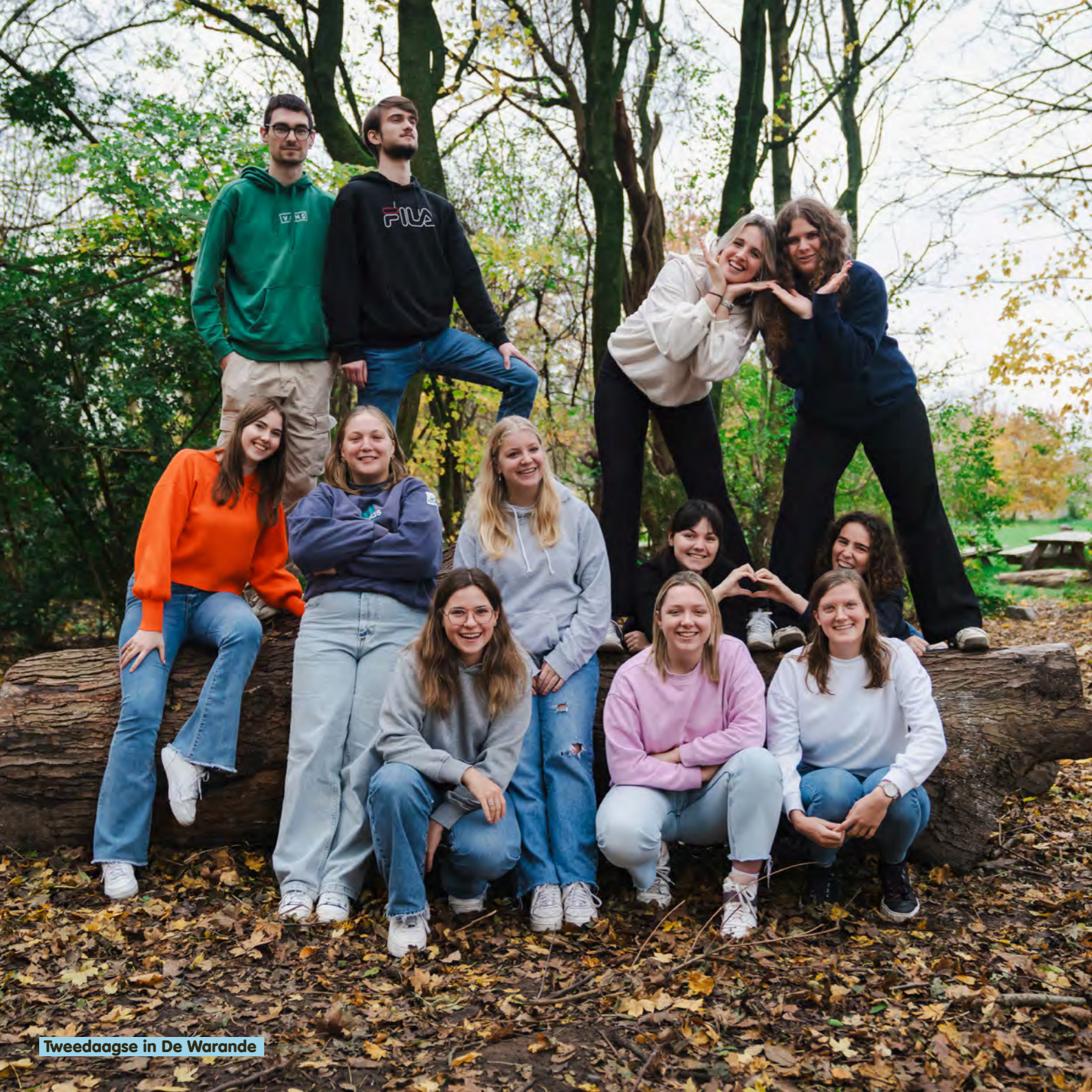
Tweedaagse in De Warande